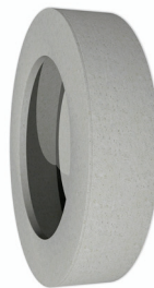
Bodli mit 60mm Füßen