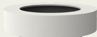
Bodil (BD) mit 60mm Füßen