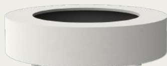
Bodil (BD) mit 60mm Füßen